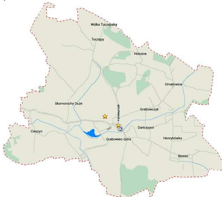
Ryc. 1 Gmina Grabowiec