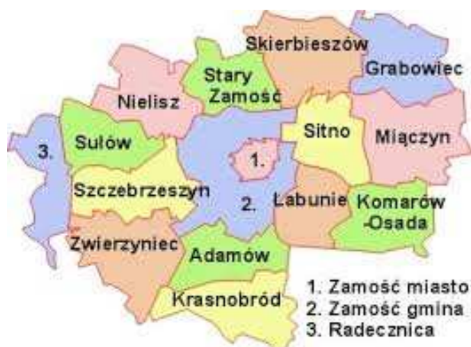
Ryc. 2 Gmina Grabowiec na tle gmin powiatu zamojskiego

potwierdzającym to nadanie Grabowiec jest wymieniony jako oppidum (miejsce obwarowane). Odtąd też aż do pierwszego rozbioru Polski Grabowiec pozostaje stolicą powiatu najpierw w księstwie bełskim a od 1462 roku w województwie bełskim wchodzącym w skład Korony. W 1394 roku Ziemowit IV utworzył w Grabowcu utworzył parafię rzymsko - katolicką bardzo rozległą gdyż obejmującą 26 wsi. Miasto wraz z istniejącym tu od dawna zamkiem zostało zniszczone przez Tatarów w 1500 roku. Zamek w Grabowcu istniał już w XIII wieku a po zniszczeniu w 1500 roku został odbudowany.